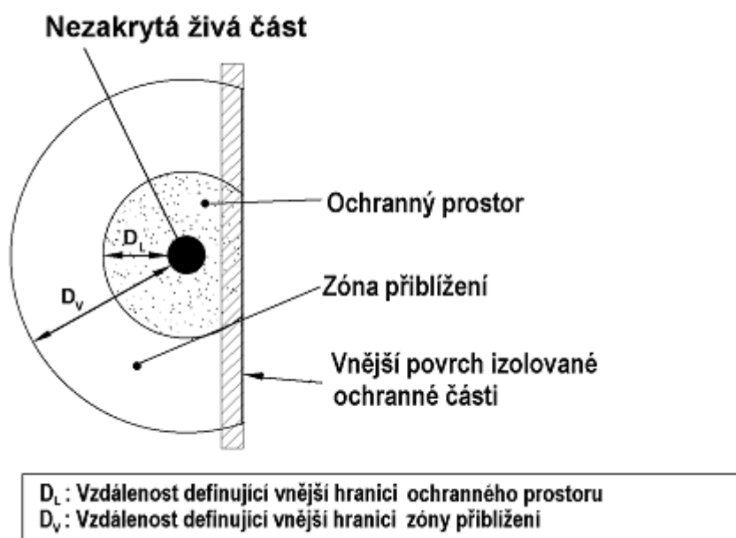
Obrázek 2 - Ohraničení ochranného prostoru použitím izolované ochranné části